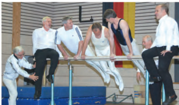
Barrenturnen der Turner im Wechsel mit der „Gesangsriege“ des Kammerchores Sonnenberg, zuvor MGV Gemütlichkeit, gegr. 1865