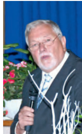
Festredner Oberbürgermeister a.D. Hildebrand Diehl