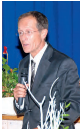
Axel Wintermeyer Staatsminister