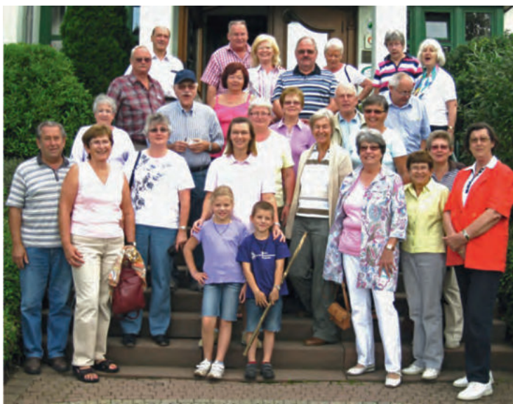
Wandergruppe in der Rhön vom 19. bis 21. August 2011