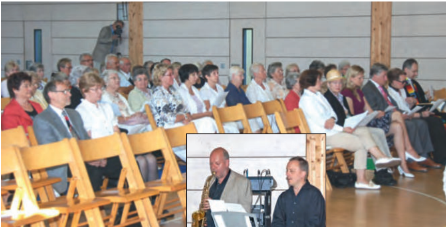
Aufmerksame Zuhörer der außergewöhnlichen Kirchenmusik von: