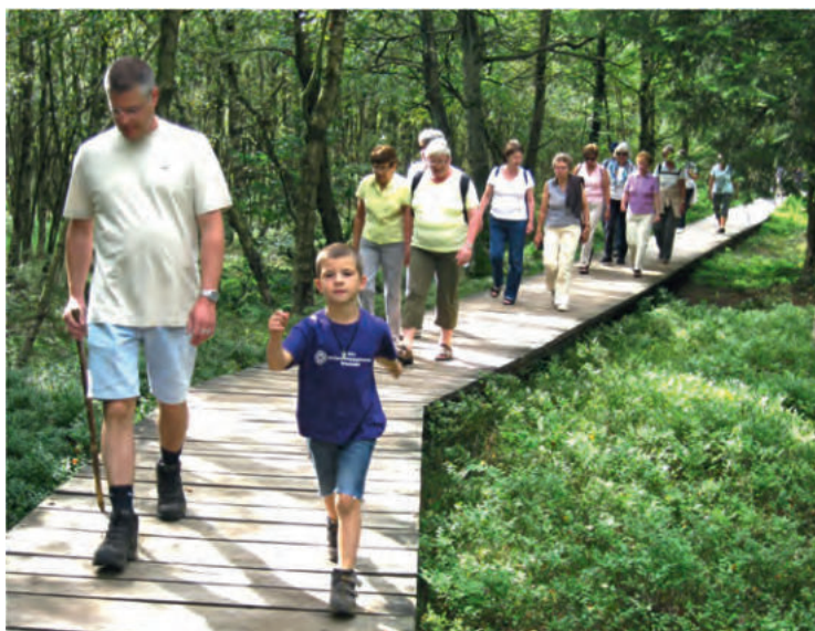
Wanderung rund um den Heidelbergstein und im Roten Moor