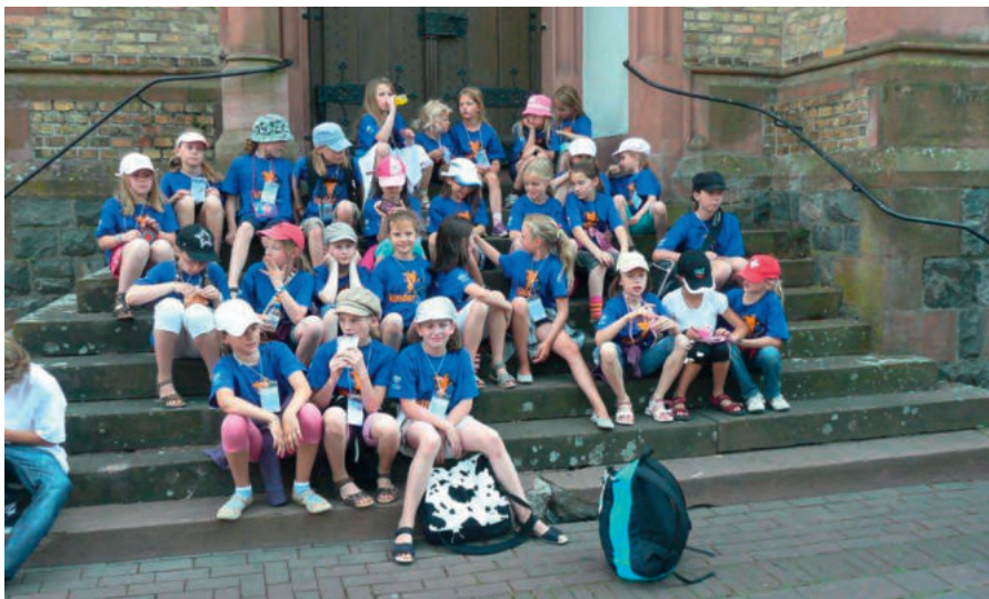
Sonnenberger Turnkinder vor ihrer Schulunterkunft in Viernheim