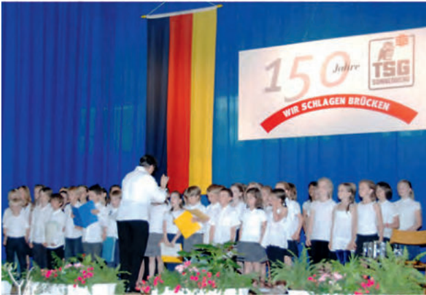
Chor der Konrad-Duden-Schule Sonnenberg