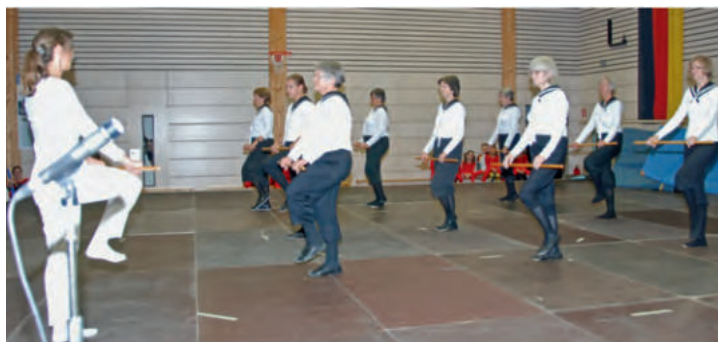
Stabgymnastik der Turnerinnen