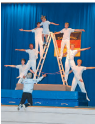
Leiterakrobatik der Jugendturner